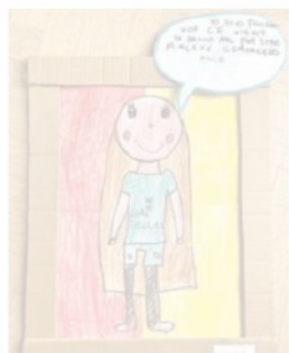
Uno dei disegni