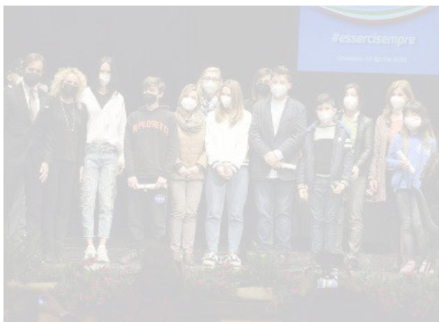
Un momento della cerimonia di ieri nel teatro degli Industri

La Polizia ha celebrato anche in città il 170° Anniversario della sua fondazione. Una storia importante quella della Polizia che ha attraversato tre secoli, due guerre mondiali, fenomeni gravissimi come il terrorismo delle brigate rosse, le stragi di mafia, il terrorismo internazionale e tutto ciò che di più grave ha riguardato l'ordine e la sicurezza pubblica del paese. «La Polizia di Stato – ha detto il questore Antonio Mannoni – è un pezzo rilevante della storia d'Italia ed uno dei pilastri della nostra democrazia». Anche quest'anno la manifestazione è stata caratterizzata dallo slogan «Esserci Sempre». Il Questore ha deposto una corona di alloro alla lapide che ricorda il sacrificio dei caduti della Polizia all'ingresso della Questura. Il momento del ricordo è stato particolarmente significativo «quale segno tangibile verso tanti operatori della polizia che hanno servito lo stato fino al sacrificio estremo della propria vita». Suc-