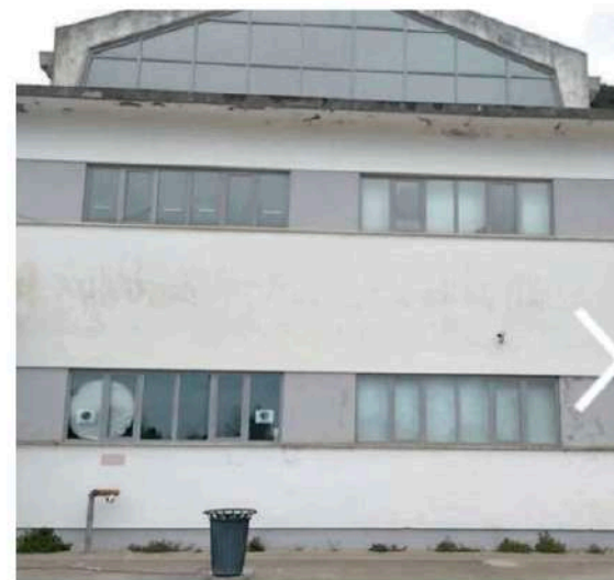
Gli ex bagnetti che saranno presto affrescati

Il tema del murale sarà legato all'attività lavorativa storica di Gavorrano. «Per me è un onore e una responsabilità molto importante - spiega