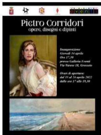
La locandina della mostra

L'inaugurazione verrà fatta giovedì 14 aprile negli spazi della galleria eventi, in via Varese, a Grosseto. La mostra rimarrà in essere fino a domenica 24 .