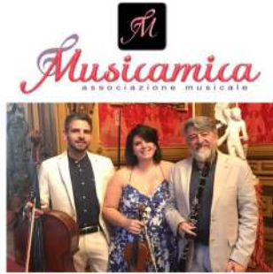
Trio Lanzini in concerto a Genova