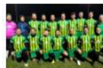
Uisp: 20' e Venturina negli apogliai, Montemazzano vota